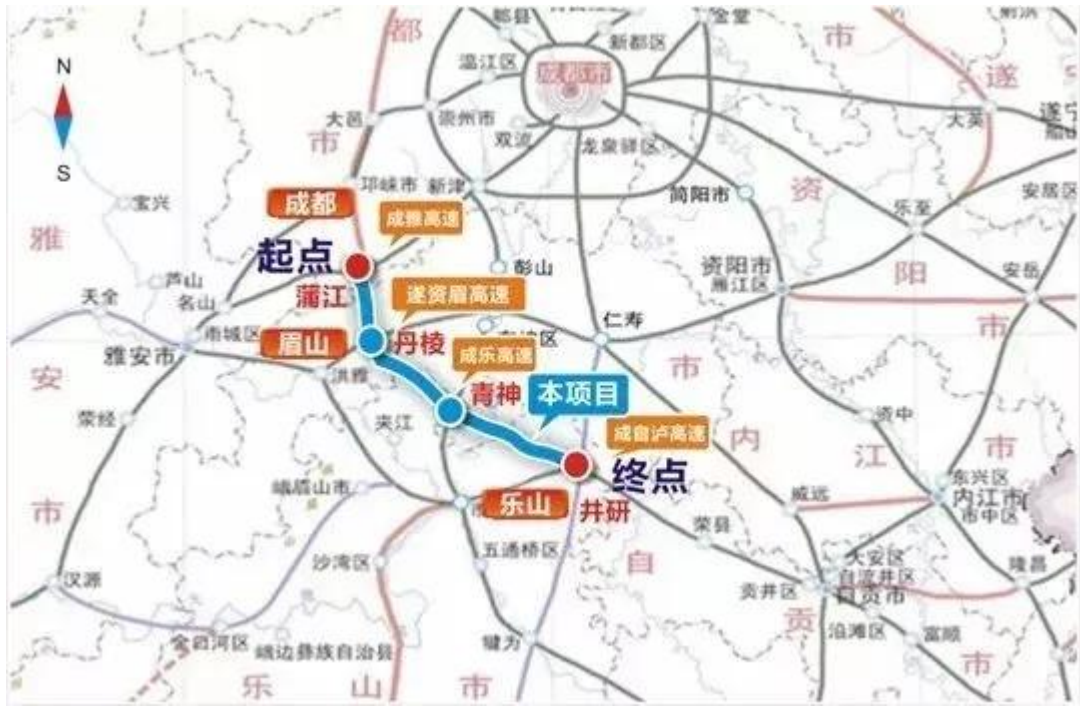
蒲井高速公路示意图

“十三五”期间，新建成高速公路3条133.5公里，扩容改造高速公路1条58.5公里。