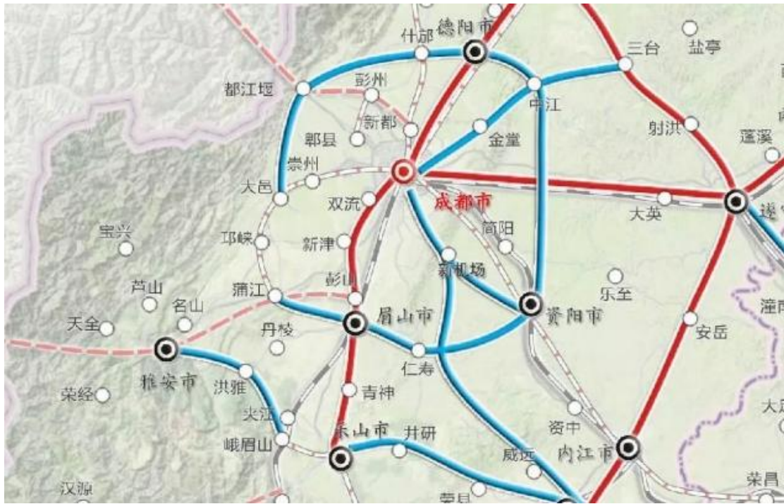
成都都市圈环线铁路规划示意图

争取开工建设成都都市圈环线铁路眉山段、天府新区轨道交通1号线(TF1)至眉山延伸线、雅眉乐铁路眉山段等。“十三五”期间，确保新建成铁路4条172公里。