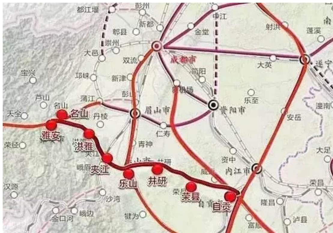
雅眉乐铁路示意图（站点仅供参考）

在 2015 年 9 月发布的《成渝地区城际铁路建设规划（2015~2020 年）》中，成都都市圈环线铁路首次亮相，是一条串起雅安、眉山、乐山、遂宁、资阳等的市际铁路路线。