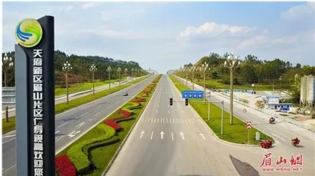
经过绿化过后的天府大道视高园区段

新开工建设环天府新区快速通道、天府大道黑龙滩至眉山段、天府大道仁寿连接线、仁洪快速通道仁资段、红星路南延线、仁简快速通道、丹棱至蒲江快速通道、太和大道、岷东新区至黑龙滩快速通道、天府大道眉山段与岷东大道连接线、彭山西山